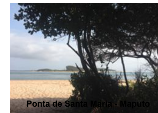
Ponta de Santa Maria - Maputo